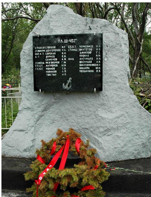
Памятник погибшим членам экипажа подводной лодки Щ-402